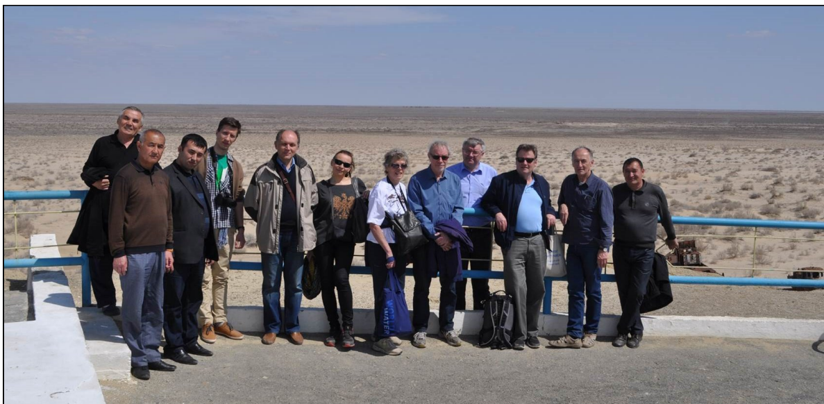
Команда Узводы у остатков Аральского моря