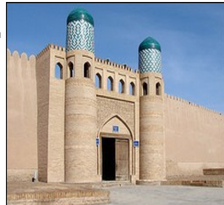
Ворота крепости в Хиве .

В среду был организован круглый стол для университетских работников и других заинтересованных сторон. Особенно интересными были представители очень продуктивного NGO KRASS, своего рода консультанты,